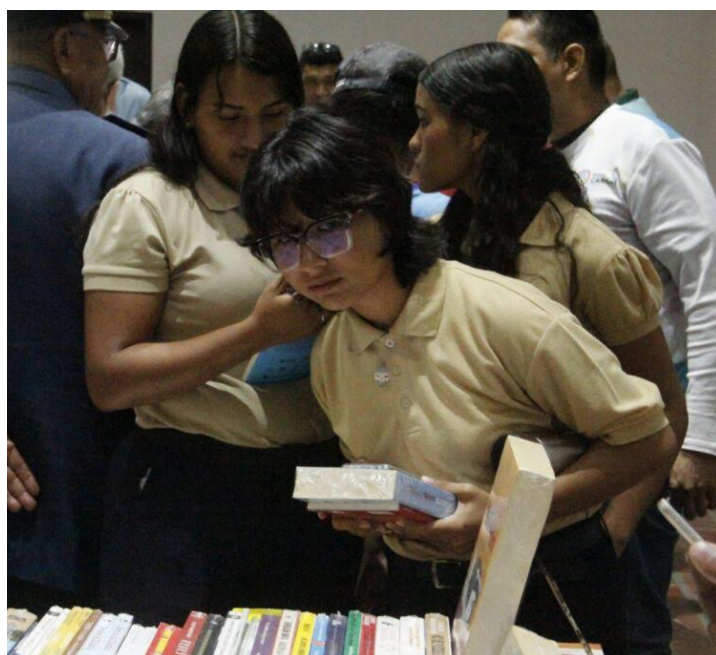
La juventud también se acercó