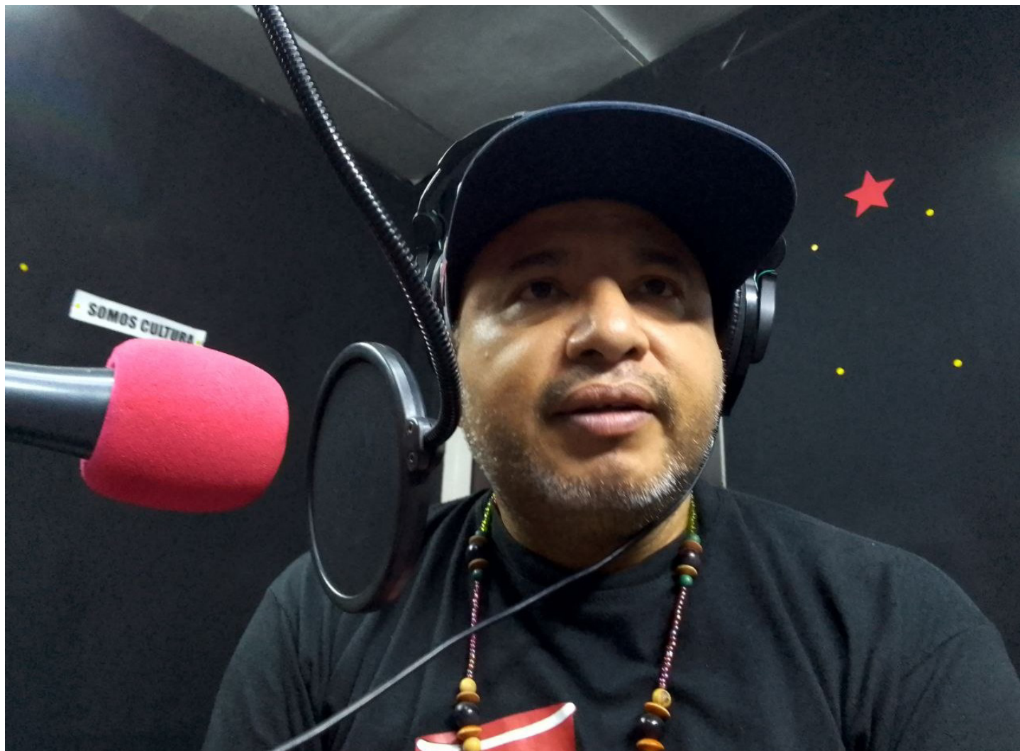
Caraqueño asentado en La Guaira