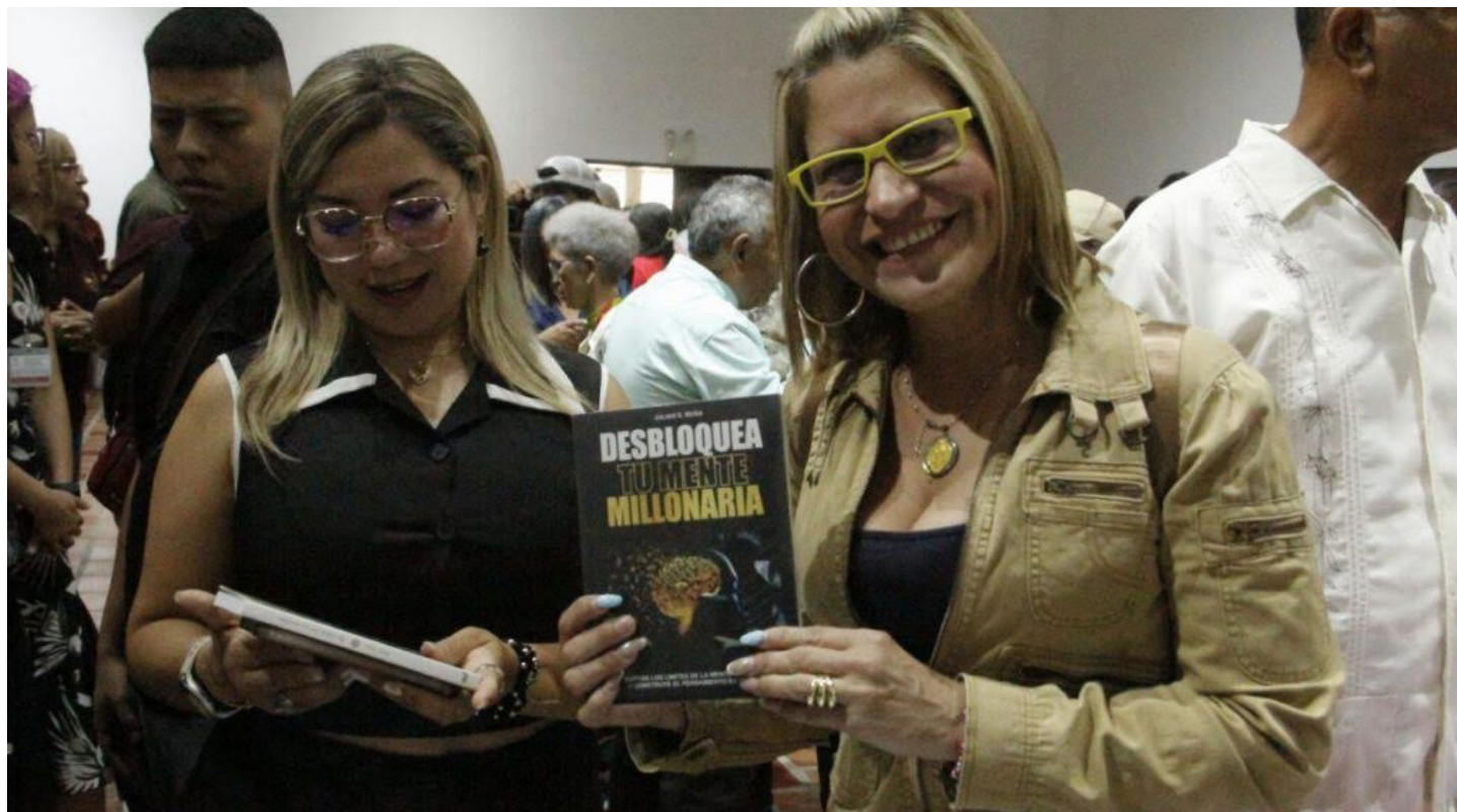
Desbloquear la mente fue una de las consignas

En la Filven capítulo Bolívar, organizada por el Ministerio del Poder Popular para la Cultura, el Centro Nacional del Libro (Cenal) y el Gabinete de Cultura, esta Fiesta del espíritu floreció hoy más que nunca, impulsada por la revolución cultural y el latido indómito de la Gran Misión Viva Venezuela Mi Patria Querida.