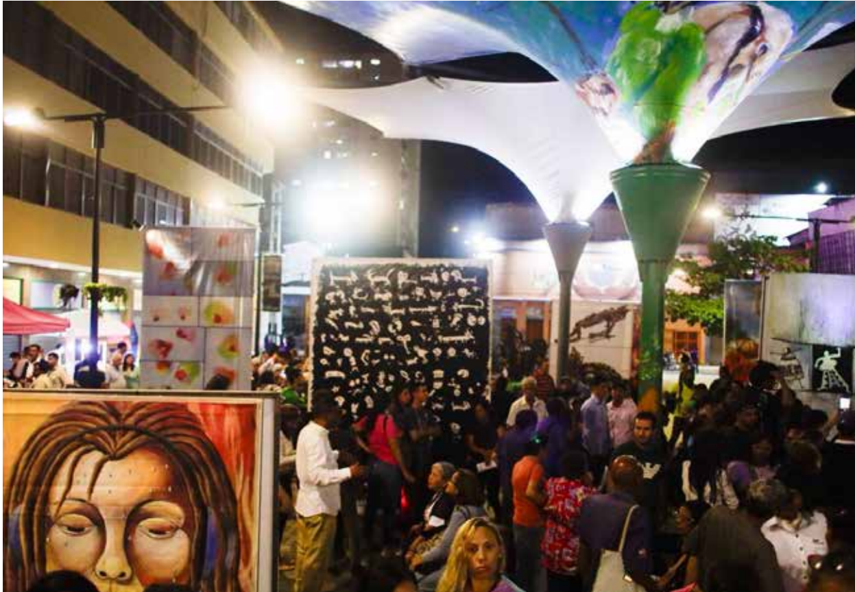
El encuentro de las artes ha visitado los estados Caracas, Bolívar, Zulia, Lara, Carabobo Aragua.