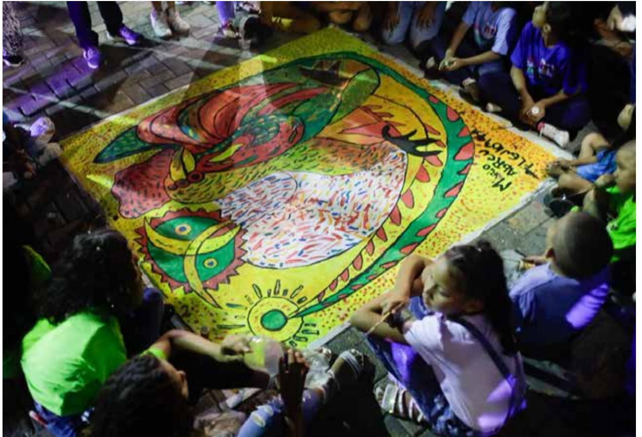
En el año 2015 se creó la Bienal del Sur con la participación de 33 países.

Luego de seis ediciones la Bienal del Sur, va consolidando su presencia en el difícil contexto de este tipo de eventos, afirmándose como alternativa contraria a la hegemonía de los circuitos del arte internacional, determinados por intereses de mercado. Desde sus inicios nuestra Bienal convoca y exhibe propuestas de creación que tanto en sus contenidos como en su resolución reafirman una posición decolonial y posturas críticas en relación con las problemáticas que desde ámbitos transnacionales afectan la soberanía y autodeterminación de los pueblos libres del mundo. Para esta edición 2025 – 2026, el evento está dedicado a los BRICS: China, India, Rusia, Sur África y Brasil, con el sub-título El Poder de la Diversidad. Consideramos absolutamente relevante exaltar en esta oportunidad la propuesta económica y cultural de este grupo de países que surgen como alternativa al sistema