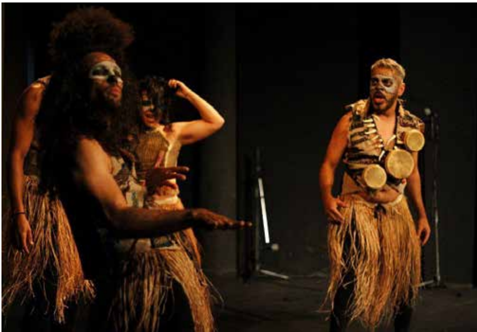
El grupo Escena Rompía presentó la obra La Tribu.