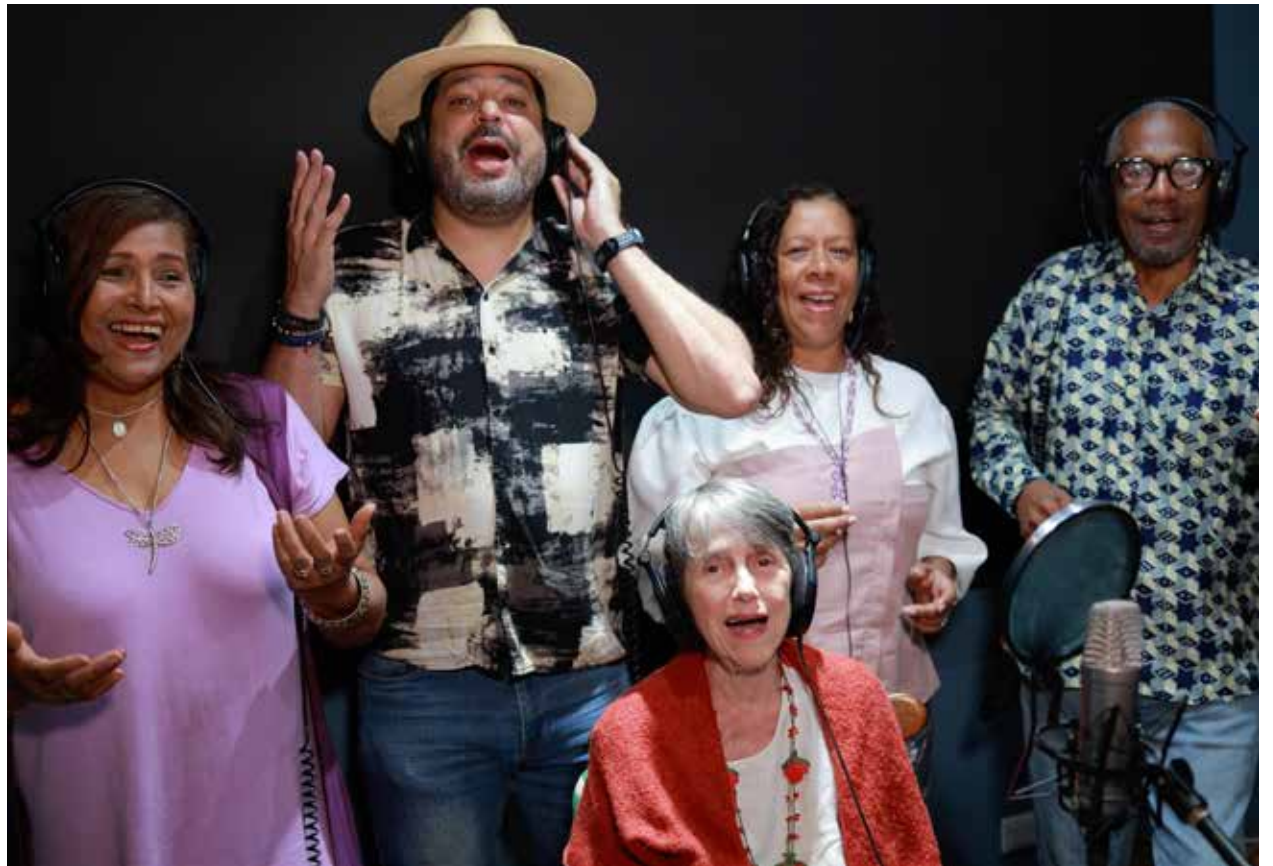
En tiempo record grabaron la pieza musical que visibiliza la lucha contra la opresión extranjera.

Y es que desde siempre la música tradicional