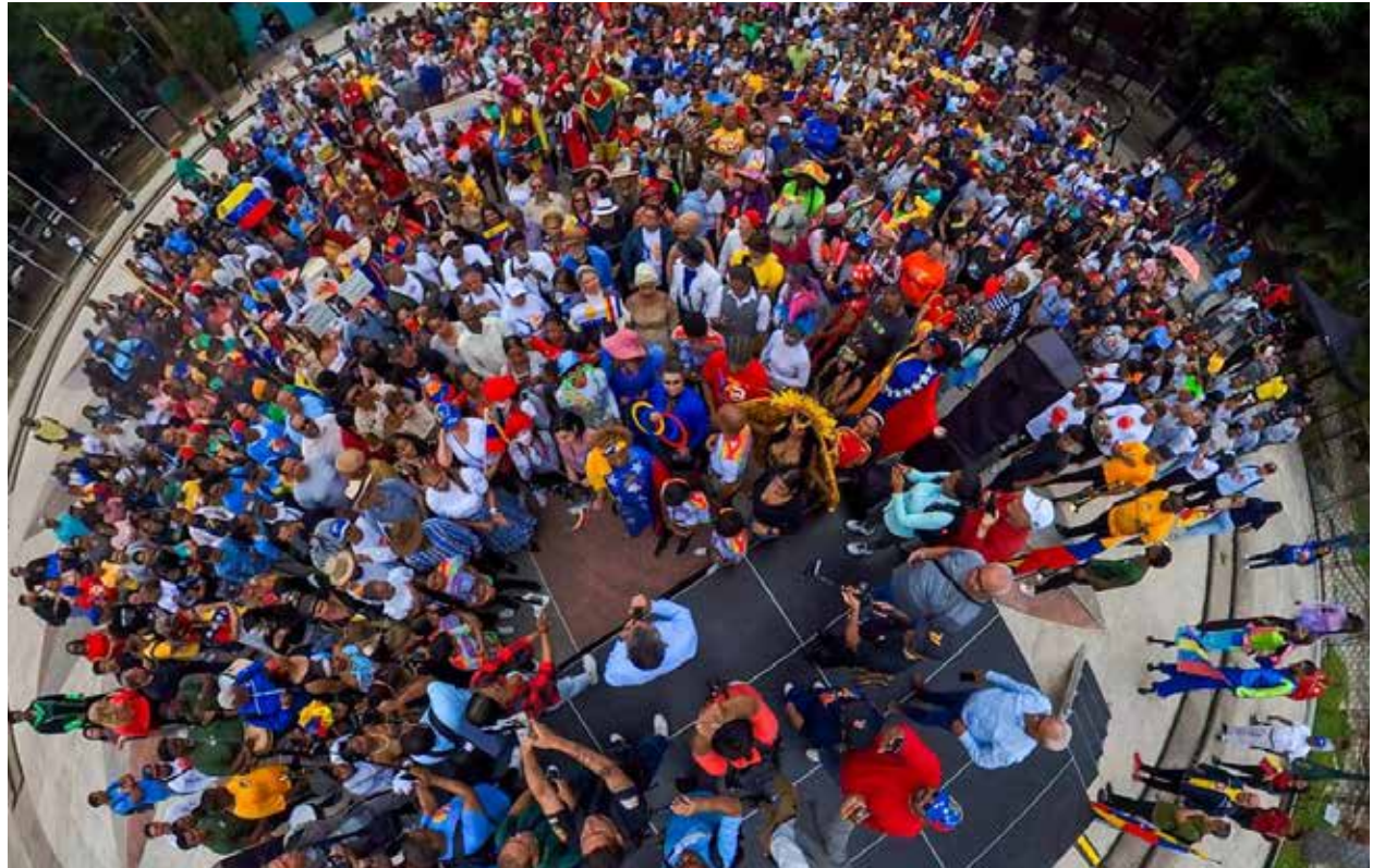
El pueblo cultor se mantiene en combate por la vida y la identidad del pueblo venezolano.

La cultura en la vanguardia es un acto de amor inquebrantable que reafirma que la patria no es solo tierra, sino el alma que palpita en cada obra, en cada melodía y en cada palabra. Con el arte como bandera, el pueblo venezolano grita que su espíritu creativo y su voluntad de paz son invencibles.