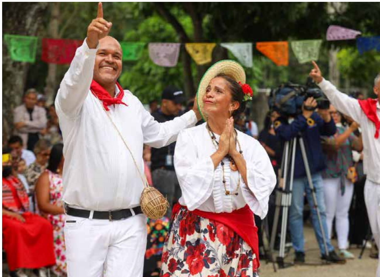
Muestra del tradicional baile de La Llorca celebrado en el estado Aragua.

Como señala la investigadora boliviana Silvia Rivera Cusicanqui, lo que persiste en la memoria ancestral es que "la alegría indígena nunca fue individual; fue un acto político de reconstitución comunitaria". De igual manera, el antropólogo Marc de Civrieux, recientemente homenajeado