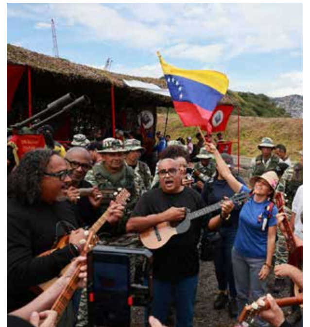
Vivieron una emotiva experiencia con FANB.

El ministro del Poder Popular para la Cultura, Ernesto Villegas, destacó durante la jornada de entrenamiento que los asistentes no están en la reserva, pero "están en la primera línea de combate todos los días por nuestra identidad cultural y nuestra diversidad cultural, que son elementos fundamentales en nuestra nación". Añadió que "el trabajo que realizan los artistas, cultores y creadores, lo ejecuta