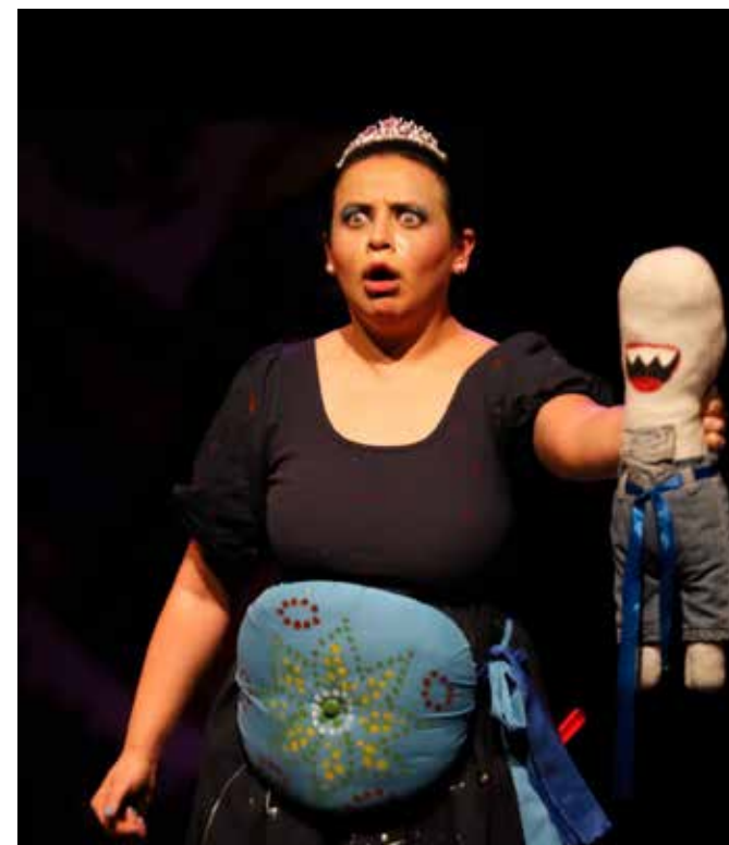
Madre, pero no Teresa ni nació en Calcuta abordó el tema de la maternidad.