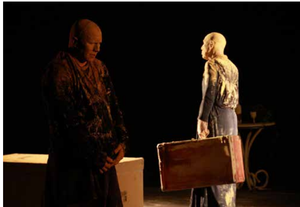
Menguada la hora está inspirada en el cuento de Rómulo Gallegos.

Noviembre pinta muy bien. La segunda etapa del Festival de Teatro Venezolano 2025 será en Caracas del 13 al 23 de noviembre, con 100 funciones de las 50 mejores agrupaciones nacionales en 16 espacios escénicos y con entrada libre.