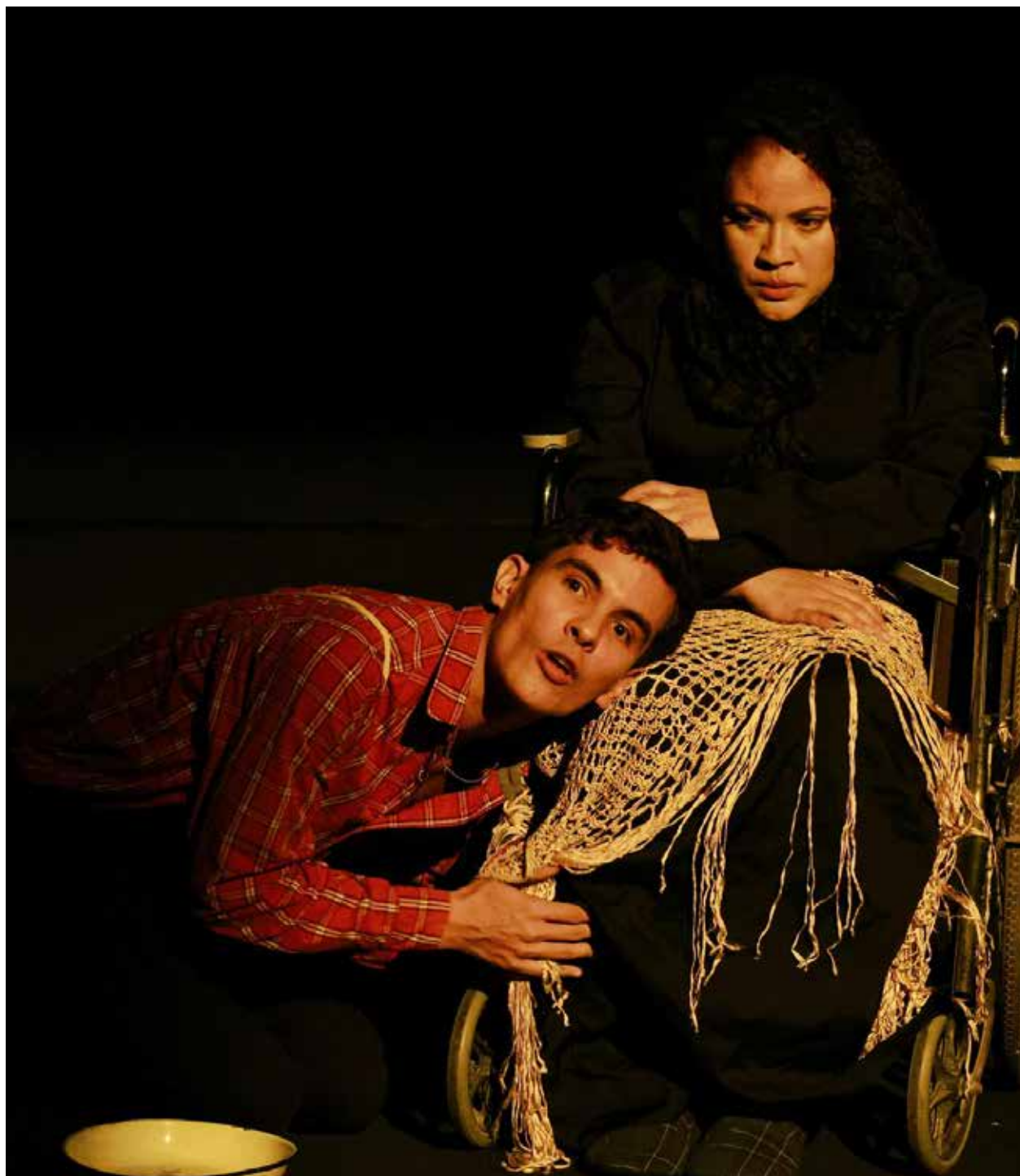
La obra "Pavlov", del dramaturgo venezolano Gustavo Ott se presentó en Caracas.

Se rompió el celofán. La inauguración del festival tuvo lugar el 28 de agosto en la Universidad Nacional Experimental de las Artes (Unearte), con la obra "Ni Enemigos Ni Extranjeros" y un sentido homenaje a los maestros Asdrúbal Meléndez y Guillermo Díaz "Yuma". El evento marcó el inicio de actividades en todo el territorio nacional, bajo la organización de la Compañía Nacional de Teatro, Misión Cultura, Gabinetes de Cultura,