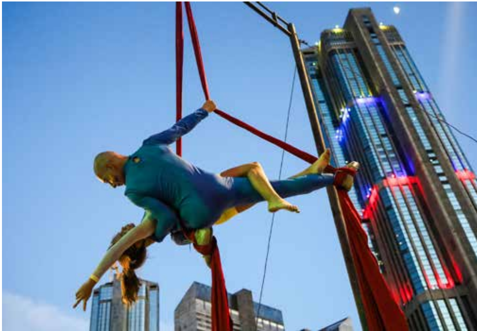
Las artes circenses tomaron la plaza La Juventud en Caracas.