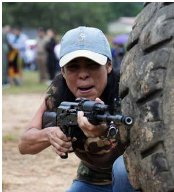
Creadores defenderán el país ante las amenazas.

Defensa de la soberanía. Cultores y trabajadores del Ministerio del Poder Popular para la Cultura (MPPC) y sus entes adscritos participaron, en una jornada de capacitación y adiestramiento para la defensa de la soberanía de Venezuela en la Academia Militar del Ejército Bolivariano en Caracas.