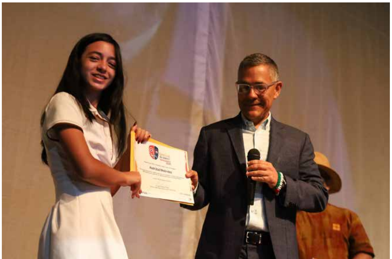
Durante el Festival el Ministro del Poder Popular de la Cultura, Ernesto Villegas entregó reconocimientos post mortem a los familiares de artistas homenajeados.