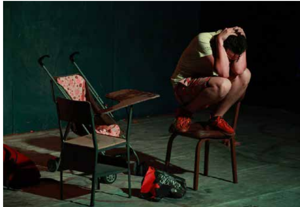
La obra "Alias El Papi" aborda la compleja realidad de la juventud.