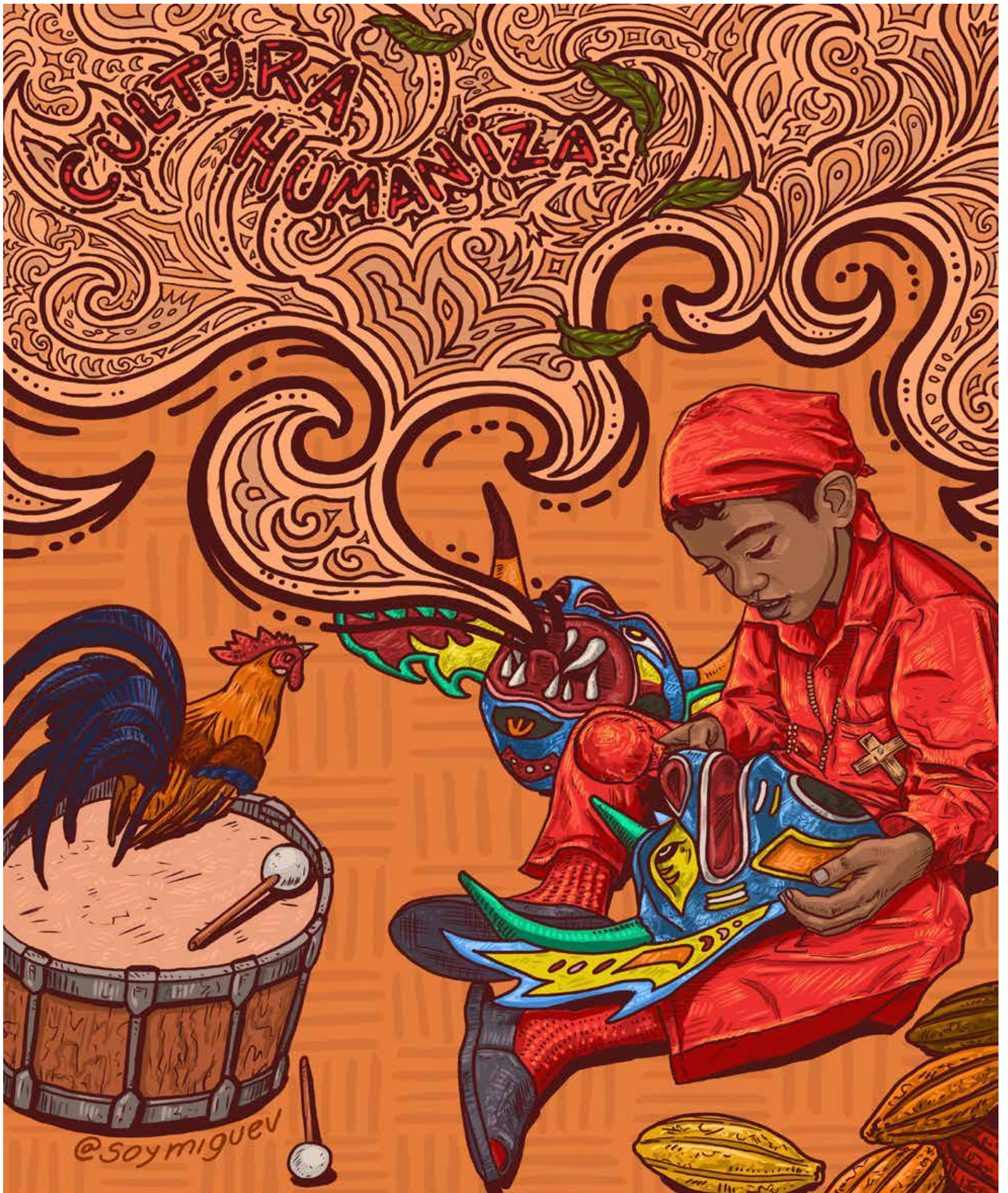
DISEÑO: MIGUEL GUERRA