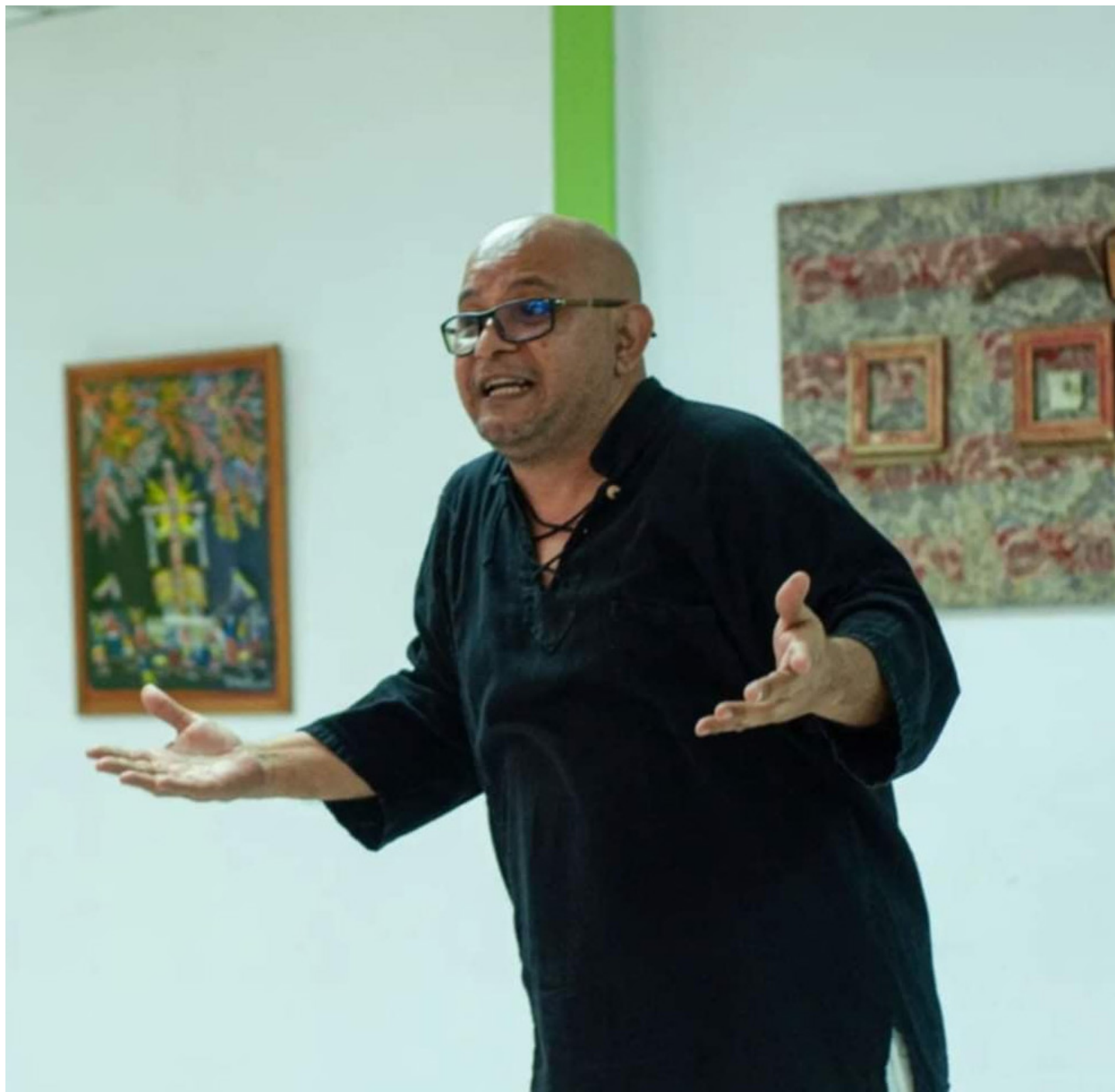
La experiencia me trastornó la vida