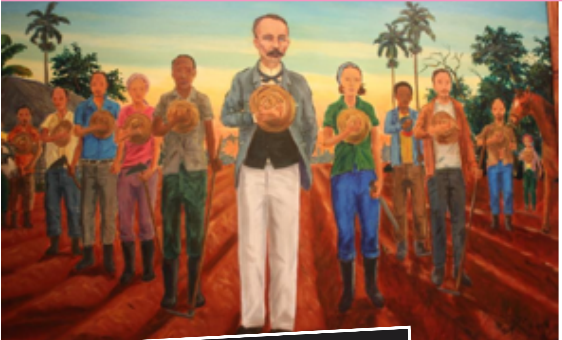
Pintura en el Memorial José Martí de La Habana

El trienio 1889 – 1891 fue de gran impacto en la vida de José Martí. En esos años se realizaron en Washington dos eventos en los que estuvieron representados los gobiernos de los países de América, del 2 de octubre de 1889 al 19 de abril de 1890, la primera Conferencia Internacional Americana, que pretendía incrementar el comercio de Estados Unidos con América Latina, y del 7 de enero al 8 de abril de 1891, la reunión de la Comisión Monetaria Internacional. Estados Unidos aspiraba establecer una hegemonía económica y comercial, igualmente política y pretendió la imposición de la plata como moneda de cambio. Martí participó como Cónsul de Uruguay. Allí desarrolló una intensa actividad para lograr la negativa de los países latinoamericanos ante las pretensiones de los Estados Unidos,