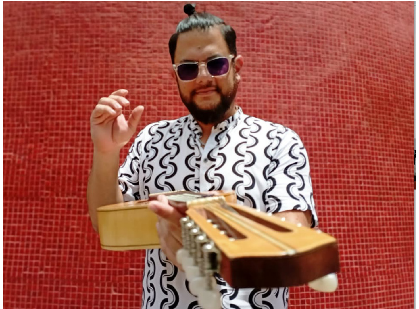
Enseña en la Cátedra de Mandolina de El Sistema

Relata que en sus estudios empezó en una estudiantina en el colegio José Félix Ribas, en la localidad