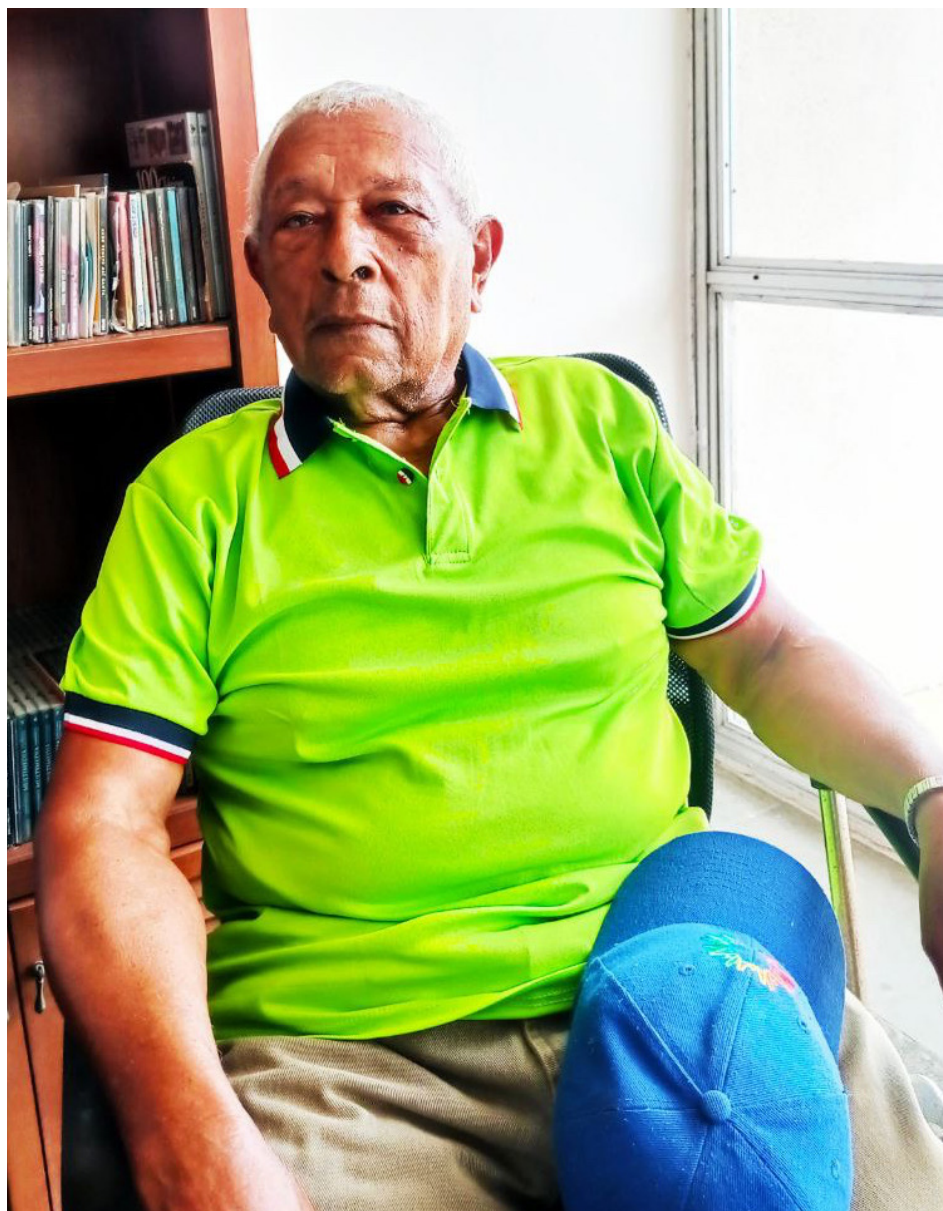
Se trata de mantener viva la llama de la Revolución Bolivariana

-Hay varios tipos de sangueo. Yaracuy, por ejemplo, tiene su sangueo y su forma de tocá y bailá. En San Millán, estado Carabobo, también tiene su forma de tocá y bailá. Aragua también tiene sus formas, sus cantos, sus maneras de bailá. Inclusive, allí cada población, cada comunidad,