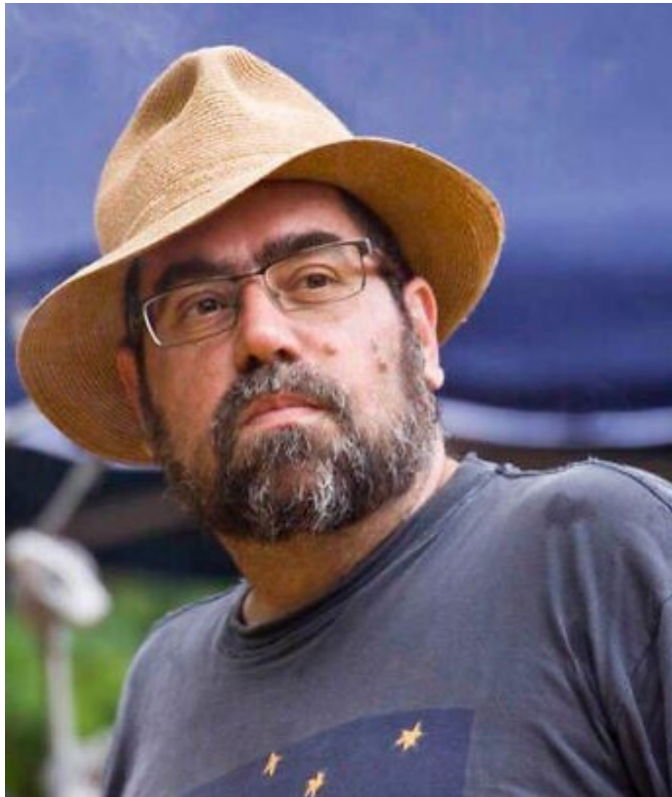
Caraqueño, creador, investigador y cineasta