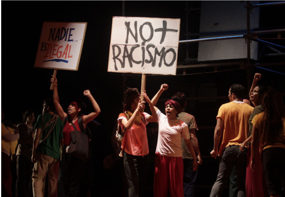
La producción se realizó en dos meses aproximadamente.