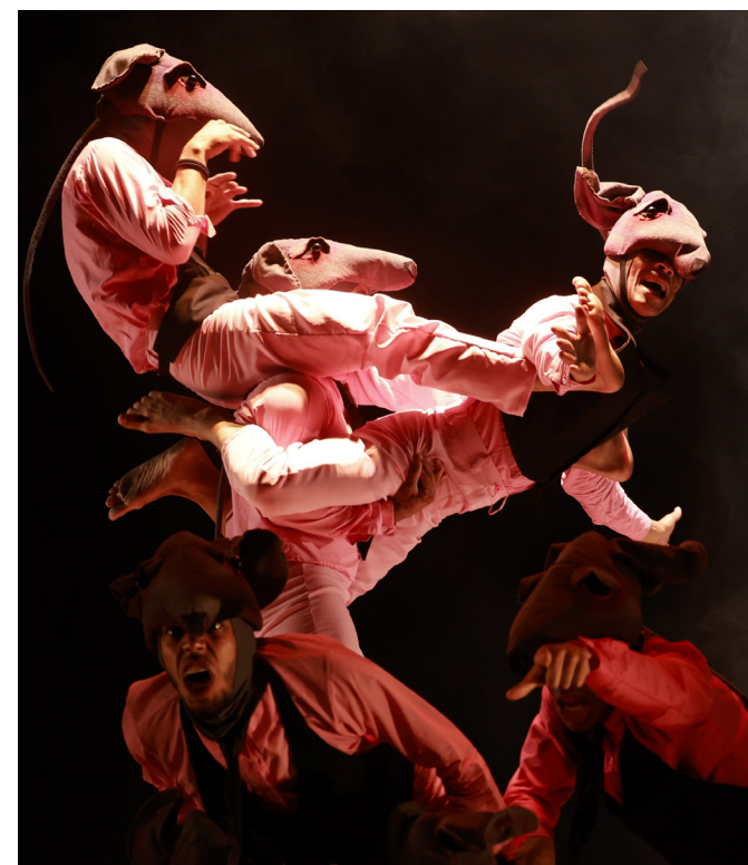
Los actores son especialistas en artes circenses y realizaron prácticas diariamente.

Gracias a la gran acogida del público en sus presentaciones, la puesta en escena visitará la Universidad Nacional Experimental de las Artes (UNEARTE) y en el Teatro Enma Soler en Los Teques, estado Miranda.