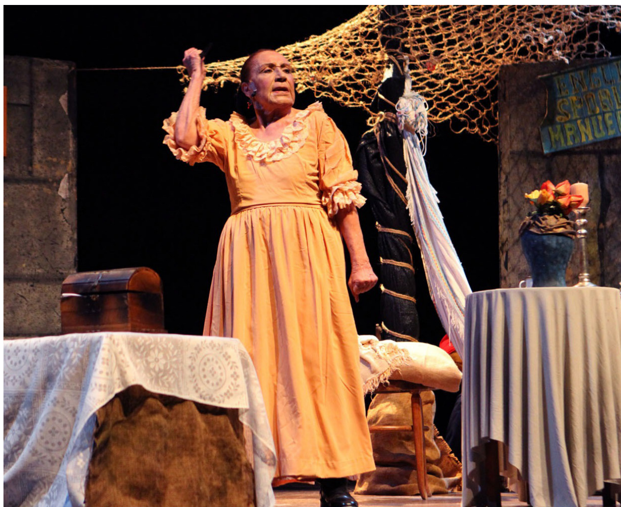
En la Gran Misión Viva Venezuela el protagonismo femenino se manifiesta con fuerza.

En este contexto, la Gran Misión Viva Venezuela, mi Patria Querida, emerge como un espacio vital donde el protagonismo femenino se manifiesta con fuerza y positividad. Las mujeres venezolanas