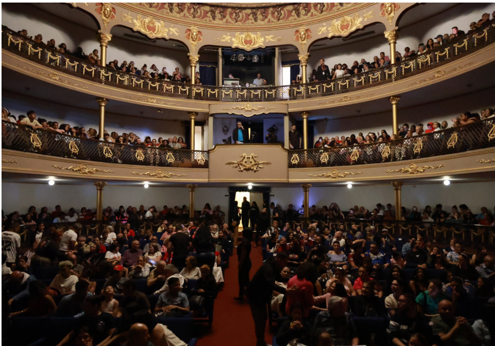
Su estreno fue a sala llena en el Teatro Nacional Román Chabaud.