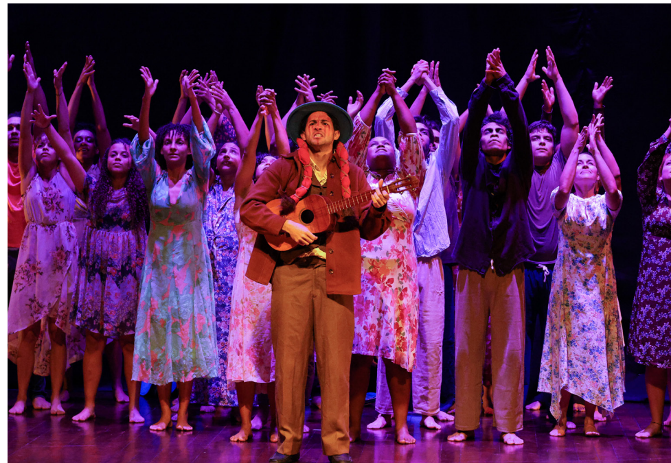
El equipo contó con 63 personas, entre ellos 36 intérpretes.