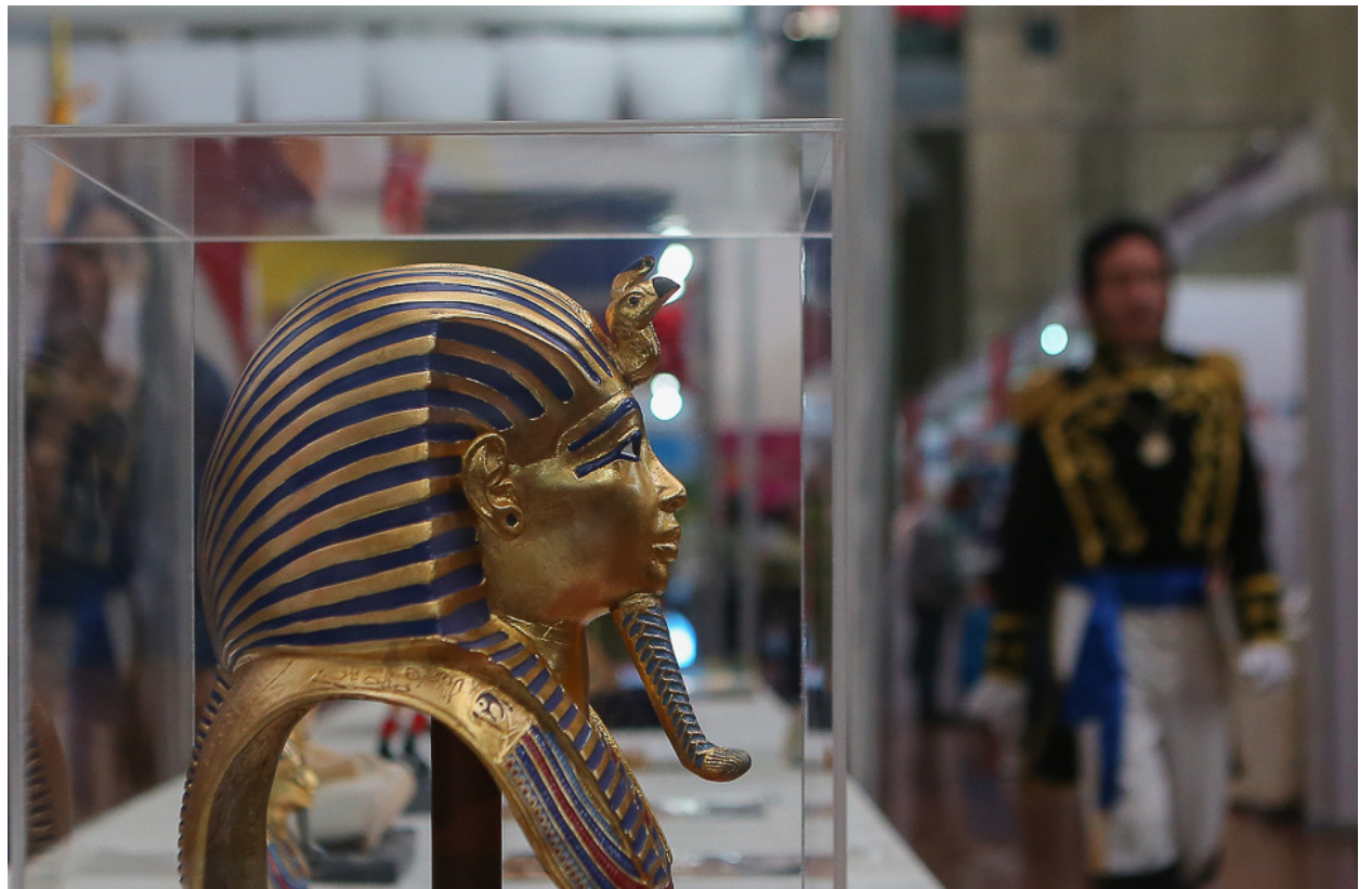
Cada año la Feria se despliega en Caracas y en todas las regiones del país.

Desde su fundación, la FILVEN ha contado con países invitados de honor que han enriquecido la programación con sus aportes literarios, históricos y culturales, en tal sentido, la primera edición, en 2005, tuvo como país homenajeado a Brasil, seguido por Cuba en 2006 y Argentina en 2007. En los años sucesivos destacaron Ecuador (2008), Bolivia (2009), Uruguay (2012), Puerto Rico (2015), Francia (2016), Turquía (2017), China (2018 y 2019), México (2020), Vietnam (2021), Colombia (2023) y Sudáfrica (2024).