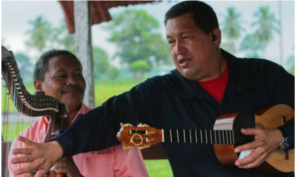
Una de sus obras fundamentales es el “Libro Azul” publicado en el año 1992.

Chávez también fue un narrador popular, un