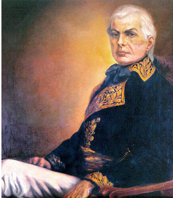
Francisco de Miranda.

A los efectos, examinemos las Actas de las 10 sesiones que tienen lugar desde el 20 de junio de