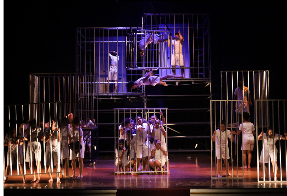
Hilda de Luca y Nicky García realizaron la producción y escenografía.