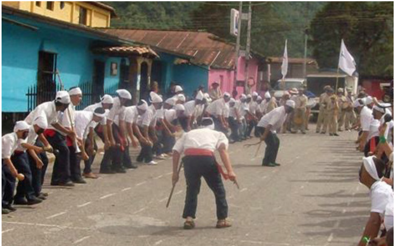
"No puede haber revolución si no hay un proceso cultural" expresó el Comandante en 2005.

Testimonio histórico. Las actividades dan inicio en la víspera del 29 a las 6 de la tarde, una vez congregados los devotos en la Iglesia del pueblo salen con la sacra imagen del Santo en hombro de cuatro portadores, los estandartes de cofradías religiosas locales, el Sacerdote y demás fieles en la procesión, a lo largo de ésta, los devotos.