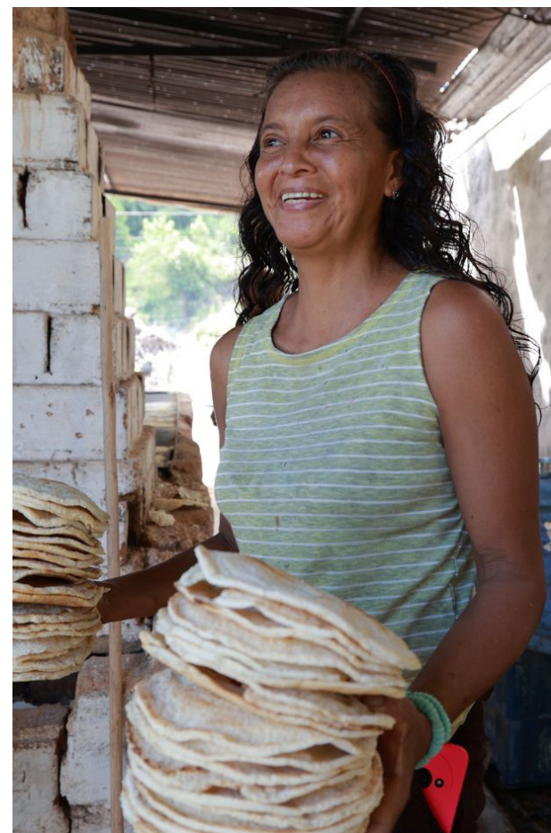
Realizadora de casabe en el estado Miranda.

La cestería y la alimentación: Un vínculo esencial. Una parte significativa de la cestería indígena se encuentra intrínsecamente ligada a los procesos de alimentación, abarcando