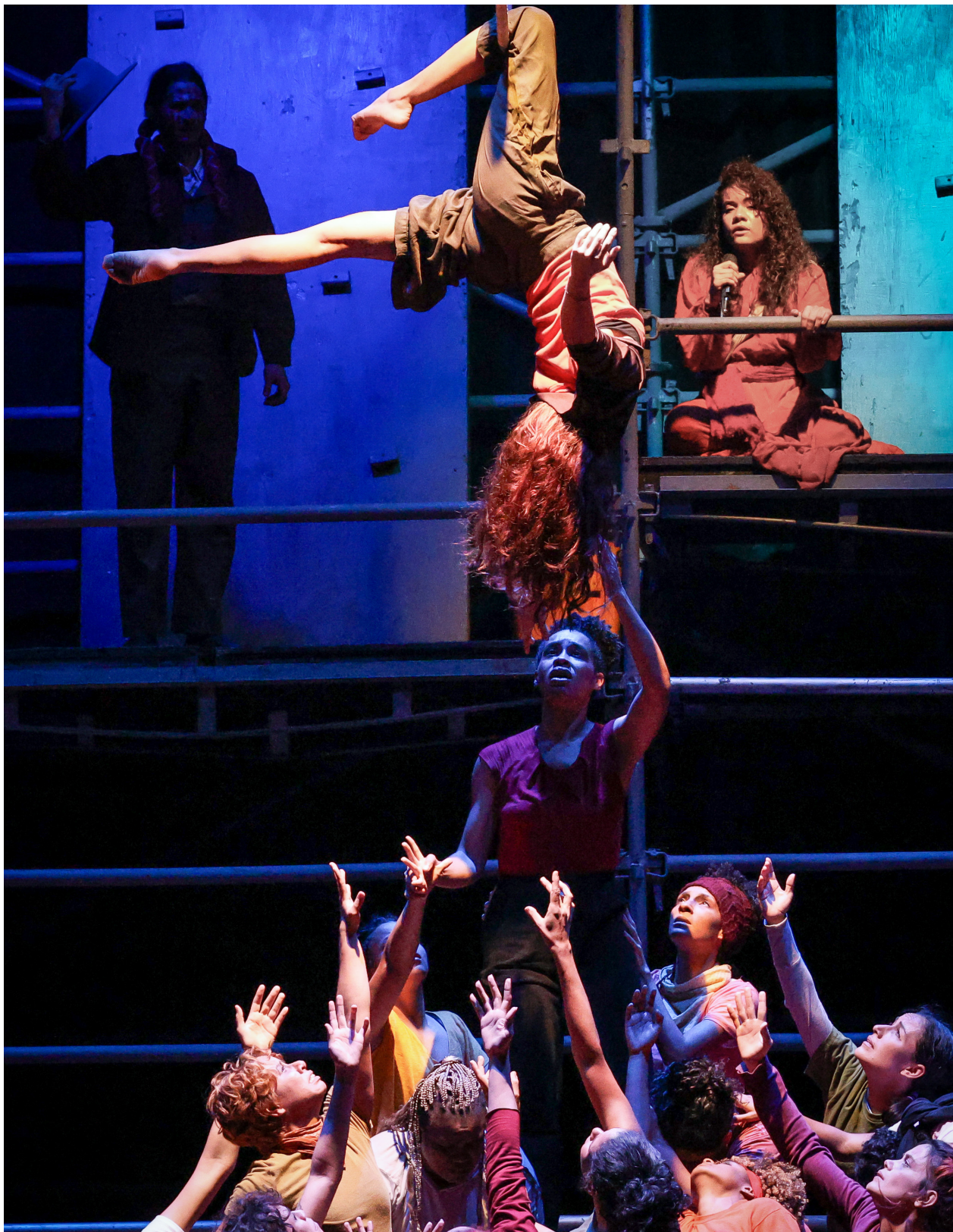
La trama denuncia la realidad que viven los migrantes secuestrados en El Salvador.

El público al entrar a la sala se encuentra con un espectáculo que desde la poesía trata de reflexionar, denunciar y mostrar la realidad de muchos migrantes en todos los territorios, no solamente en los Estados Unidos, aunque reflexiona sobre las medidas que está tomando el mandatario norteamericano contra los venezolanos y cómo han sido secuestrados en el Centro de Confinamiento del Terrorismo, (CECOT), ubicado en El Salvador. "Hay un recorrido, histórico, de todo el proceso migratorio de la Segunda Guerra Mundial hasta el día de hoy", refirió Jericó